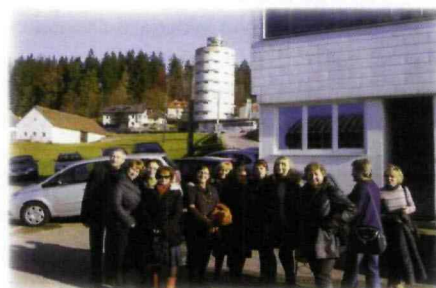
Sklep i salon sprzedaży samochodów w Rohrbach

sprzedaż bezpośrednią funkcjonującą w szeroko upowszechnionej formie zarówno wśród gospodarstw konwencjonalnych, jak i ekologicznych. Wiodącymi produktami cieszącymi się dużym zainteresowaniem klientów w tym zakresie były sery i mleko kozie, różnego rodzaju oleje roślinne, owoce oraz niskoprocentowe wyroby alkoholowe (wina oraz moszcze).