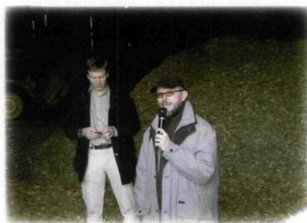
Zrębki sosnowe są doskonałym źródłem energii odnawialnej