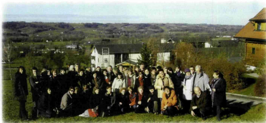
Grupa doradców w Austrii